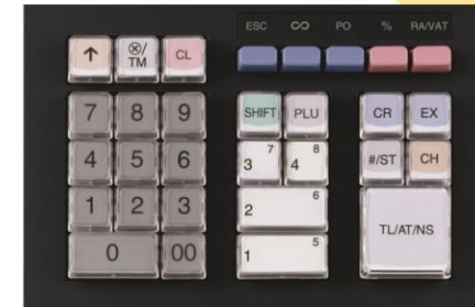
Tampilan Tombol-tombol untuk Transaksi