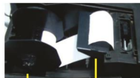
Tampilan Printer Dot Matrix

Kunci Untuk Melakukan Transaksi, Print Laporan dan Setting Program